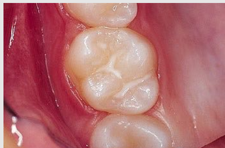
Schutz vor Karies: Versiegelung der feinen Grübchen auf der Kaufläche

Bei der Versiegelung werden die Fissuren mit einem hellen Kunststoff dauerhaft verschlossen, so dass an diesen Stellen keine Karies mehr entstehen kann (siehe Abb. unten).