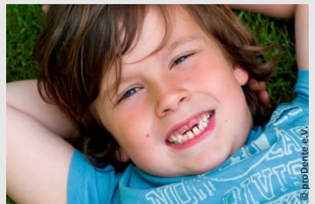
Bei der Prophylaxe lernen Ihre Kinder die richtige Zahnpflege

Es gibt also keinen Grund, warum Sie auf Prophylaxe für Ihre Kinder verzichten sollten.