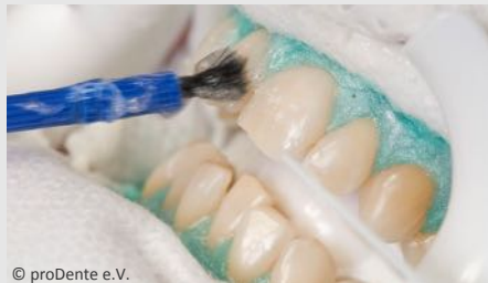
Power-Bleaching beim Zahnarzt: Auftragen des Bleaching-Gels

Wenn Sie die Praxis wieder verlassen, können Sie sich an sichtbar helleren Zähnen freuen!