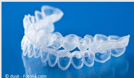
Bleaching-Form aus Kunststoff, in die Sie das Aufhellungs-Gel einfüllen.

Beim Home-Bleaching werden vom Zahnarzt dünne flexible Formen aus einem transparenten Kunststoff hergestellt, die genau auf Ihre Zähne passen (siehe Foto).