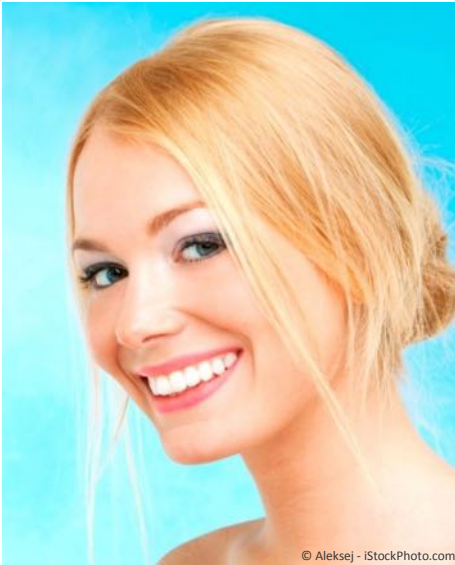
Bleaching vom Zahnarzt: Gewinnendes Lächeln mit strahlend weißen Zähnen

Professionelle Zahnaufhellung durch den Zahnarzt