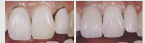
Metallkeramik-Kronen mit dunklen Rändern (links) und ästhetische Kronen aus reiner Keramik (rechts).

Wenn Sie wirklich schöne Zähne wollen, sollten Sie sich für Kronen und Brücken aus reiner Keramik entscheiden.